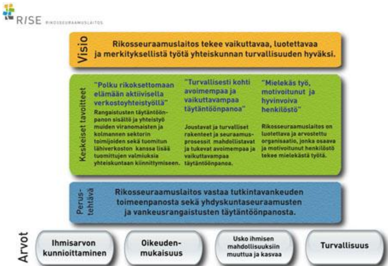
KUVIO 1. Rikosseuraamuslaitoksen strategia 2011–2020. (Rikosseuraamuslaitos, 2011)

Rikosseuraamuslaitoksen (RISE) strategiassa vuosille 2011–2020 yksi keskeisimmistä tavoitteista on aktiivinen verkostoyhteistyö (kuvio 1). Yhteistyöllä eri viranomaisten, kolmannen sektorin toimijoiden sekä tuomitun lähiverkoston kanssa lisätään tuomittujen valmiuksia yhteiskuntaan kiinnittymiseen ja rakennetaan polkua rikoksettomaan elämään. (Rikosseuraamuslaitos 2011) Verkostoyhteistyö ja rikoksettomaan elämään poluttaminen (vrt. poluttaminen koulutus ja työelämään) ovat keskeisiä käsiteltäviä asioita opinnäytetyössäni.