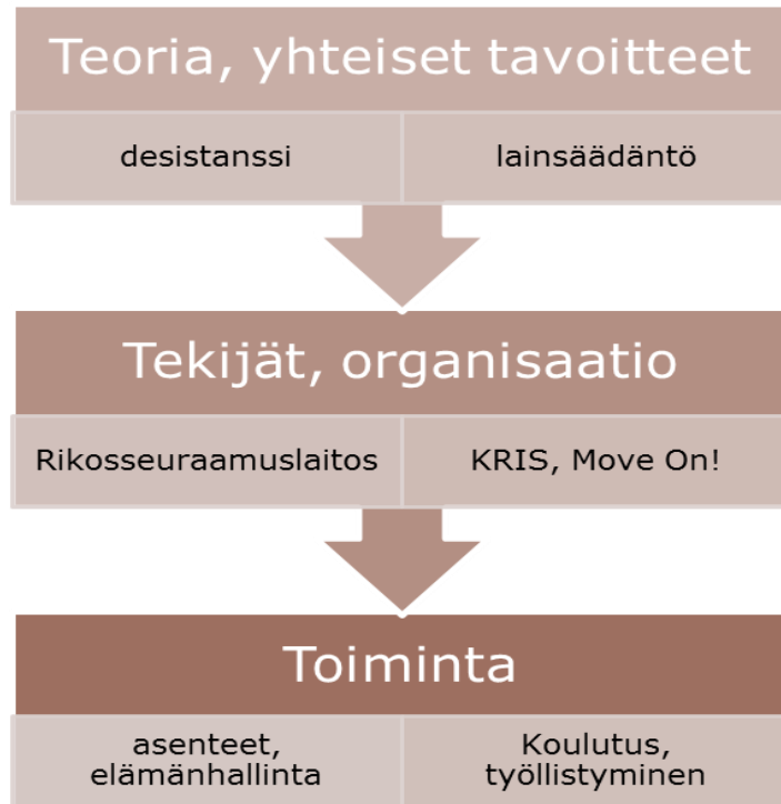
KUVIO 2. Opinnäytetyön teoreettinen viitekehys.

Opinnäytetyön teoreettisen viitekehyksen voi jäsentää eri tasoista rakentuvaksi ja toisiinsa linkittyväksi kokonaisuudeksi (kuvio 2). Korkein taso, ja kaikkiin alatasoihin vaikuttava tekijä, on Suomen lainsäädäntö. Laki määrittää toiminnan ehdot pohjaten yhteiseen tavoitteeseen, yhteiskunnan turvallisuuden lisäämisestä. Myös rikosseuraamuslaitoksen tehtävät ja toiminta on määritelty omassa laissaan.